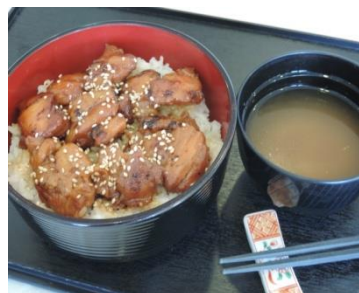
炭火やきとり丼 (タレ) 600円