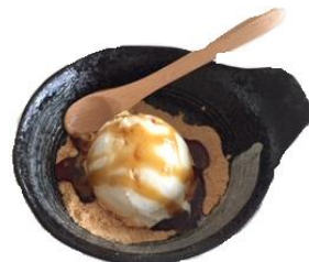
黒蜜きなこ 380円 ※お米のジェラート使用 シングルのみ

トロピカルジェラート フローズンフルーツの シャリシャリ感とバナナベースの トロピカルな味わい! シングル 300円 ダブル 500円