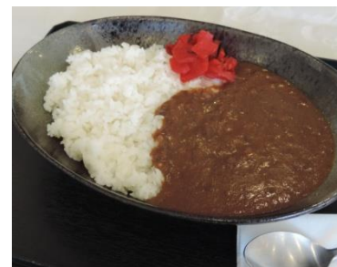
じっくり煮込みのビーフカレー 600円