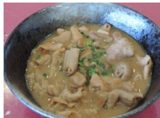
スタミナ! 豚もつ煮込 600円