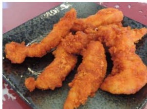
ピリ辛ササミチキン 500円