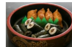
助六 一人前 ¥500-