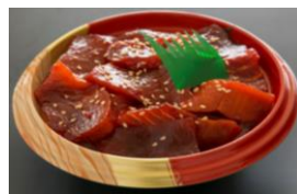
南マグロ漬け丼 (ミニサイズ) 一人前 ¥500-