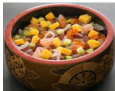
ばらちらし 一人前 ¥600-