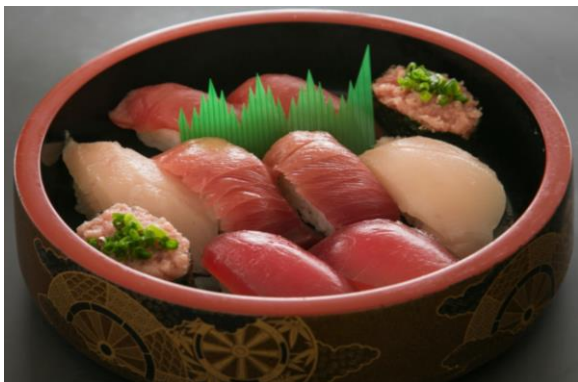
まぐろづくしにぎり (10貫入り) 一人前 ¥1,100-