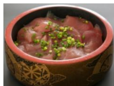
鉄火丼 一人前 ¥600-