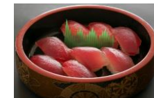
パチマグロのにぎり (8貫入り) 一人前 ¥700-