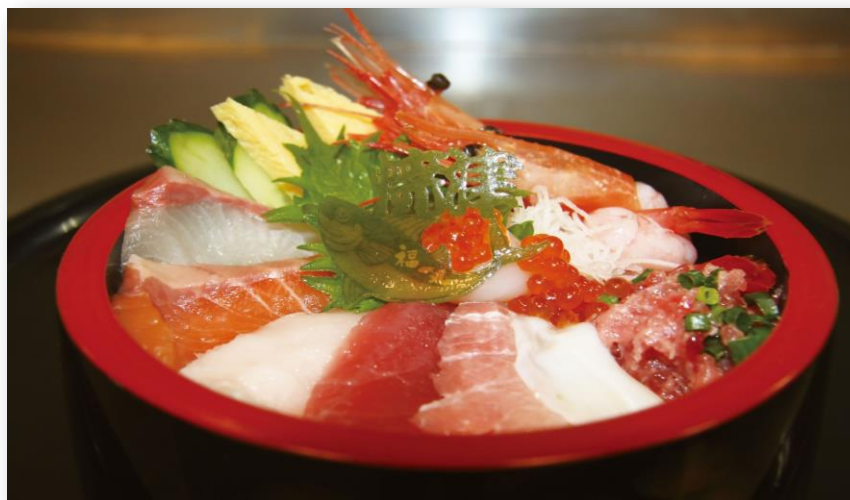
原価にてご提供！ 特選なんばん丼 一人前 ¥1,000-