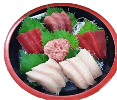
まぐろづくし刺身 一人前 ¥1,000-