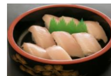
トンボマグロのにぎり (8貫入り) 一人前 ¥700-