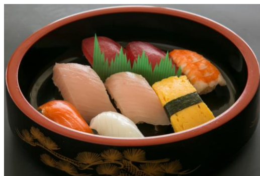
寿司盛り合わせ(8貫入り) 一人前 ¥700-