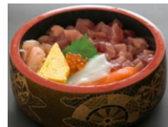
海鮮丼 一人前 ¥600-