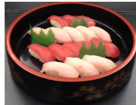
トンボマグロとパチマグロのにぎり (8貫ずつ計16貫) 一人前 ¥1,400-