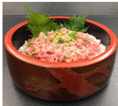
南マグロねぎとろ丼 一人前 ¥650-